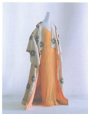
マリアノ・フォルチュニ 《室内着》 1910年代 絹タフタにステンシル・プリント 公益財団法人 京都服飾文化研究財団