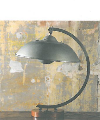
マリアノ・フォルチュニ 《テーブル・ランプ》 1925年以降 木、金属 フォルチュニ美術館

会期 2019年7月6日(土)～10月6日(日) 開館時間 10:00～18:00 ※入館は閉館の30分前まで(祝日を除く金曜、第2水曜、8/12～15、会期最終週平日は21:00まで) 休館日 月曜休館(但し、祝日・振替休日の場合、9/30とトークフリーデーの7/29、8/26は開館) 入館料・当日券 一般:1,700円 高校・大学生:1,000円 小・中学生:500円 前売券 一般のみ:1,500円