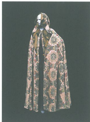
マリアノ・フォルチュニ 《フード付きケープ》 1930年代 絹ベルベットにステンシル・プリント 神戸ファッション美術館