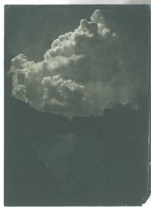
マリアノ・フォルチュニ 《雲の習作、ヴェネツィア》 1915年頃 銀塩ネガプリント フォルチュニ美術館