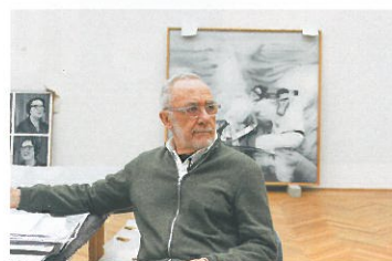
Gerhard Richter ゲルハルト・リヒター